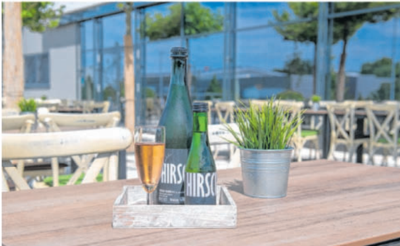
Bis zum 30. September gibt es im Back-Café Laiern zu ausgewählten Frühstücksangeboten ein Glas Perlwein „Hirsch“ gratis.

Bietigheim-Bissingen. Stöckle-Card, „Perfektes Duo“ als Kombi-Angebot, „spritziges“ Extra vom Weinbauern und mehr: Das Stöckle-Team hat sich einiges einfallen lassen für die Einführung des neuen Back-Cafés im Gewerbegebiet Laiern.