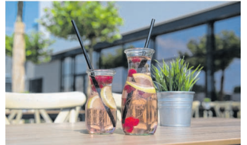
Selbstgemachte Bio-Limonaden in ausgefallenen Sorten gibt es auch – aber nicht nur – im Eröffnungsmonat.

Das Back-Café im Laiern ist seit 16. September jeden Samstag bis 17 Uhr geöffnet. Zum Beispiel für Leute, die Lust haben auf Pizza und Salat zum Mittagessen oder nachmittags auf Kaffee und Kuchen.