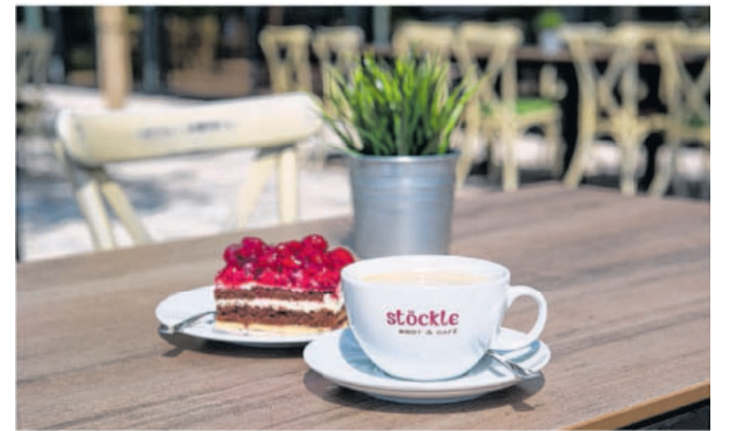
Angebot im Eröffnungsmonat: Kaffee und ein Stück Kuchen dazu für 3,90 Euro.