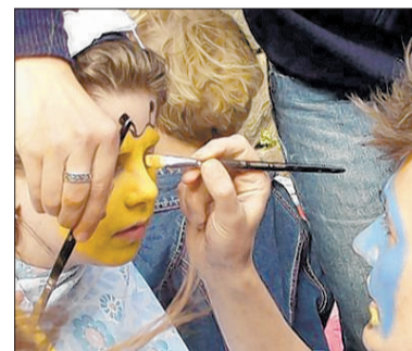
Bitte schön bunt malen.

Bietigheim-Bissingen. Wo kommen nur die bunt geschminkten Kinder in der Bietigheimer Altstadt her? Das werden sich viele Passanten am kommenden Samstag fragen. Zur Neueröffnung des Stammhauses der Bäckerei Stöckle werden die „Wobachspatzen“ ihre Kreativität und Fantasie walten lassen und zu Farben und Schminke greifen, um zahlreiche bunte Kindergesichter zu zaubern. Am Samstag ist von 10 bis 17 Uhr Kinderschminken mit den Wobachspatzen angesagt. rke