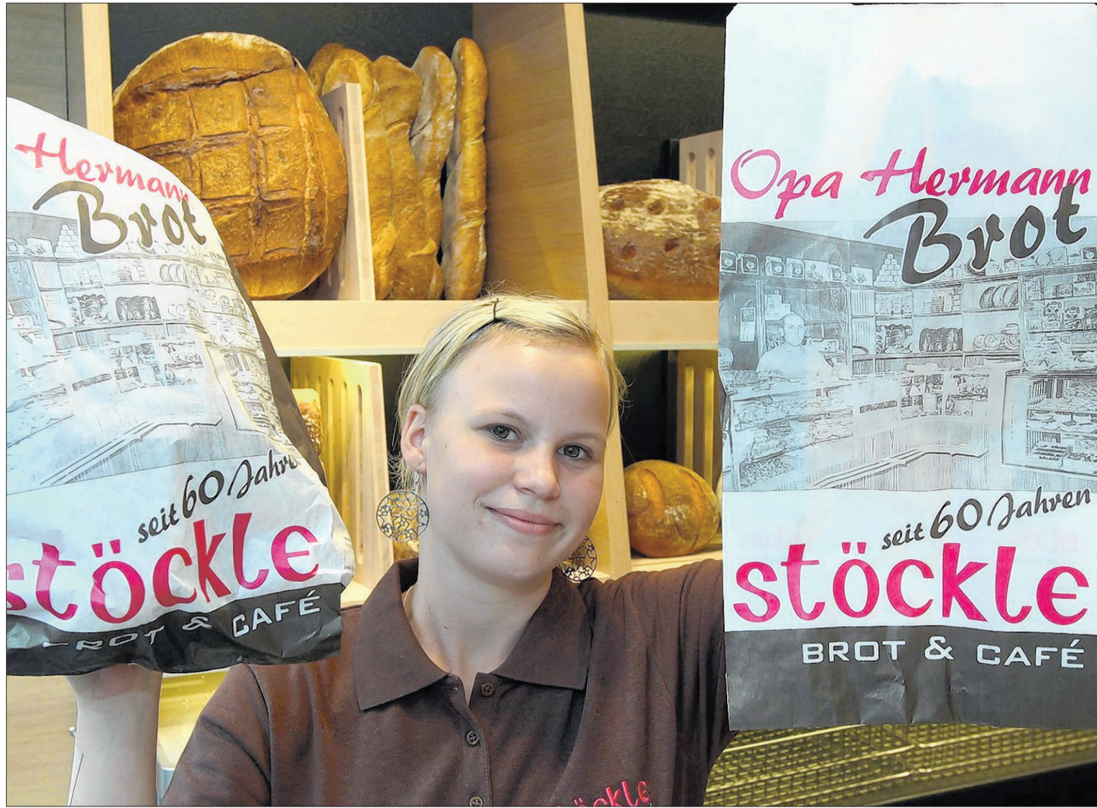
Am kommenden Samstag wird in der Fußgängerzone in Bietigheim gefeiert: 60 Jahre Stöckle und Neueröffnung des Stammhauses. Und zur Feier des Tages gibt es „Opa Hermann Brot“.